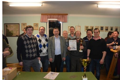
Die Sieger: Die Mannschaft der FF Gr. Göttfritz